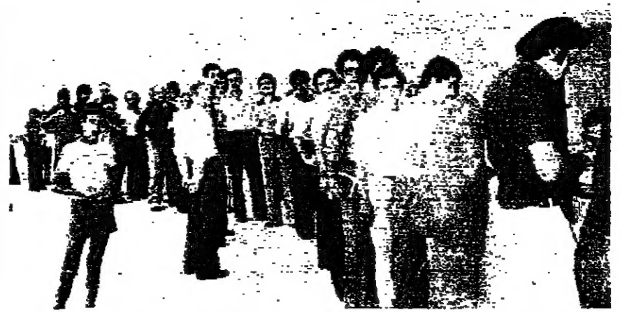
صف طويل من المواطنين بمسدة افتتاح المركز أمس